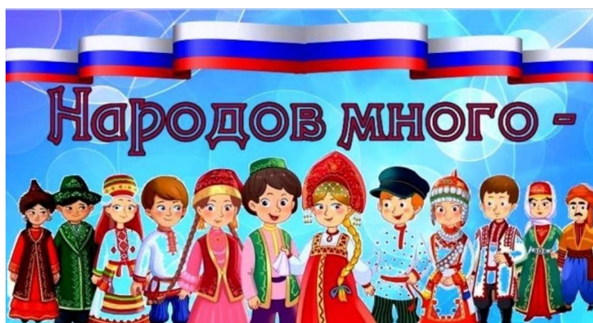
День народного единства!