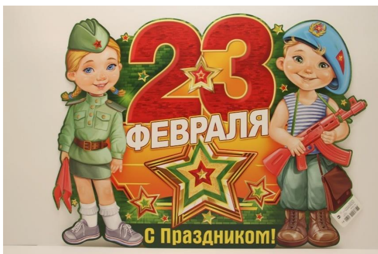
День защитника Отчества!